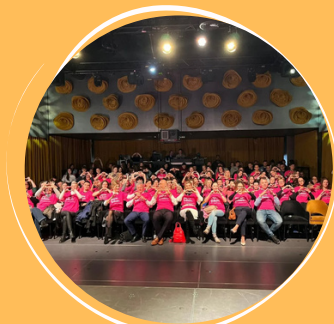
Dan ružičastih majica