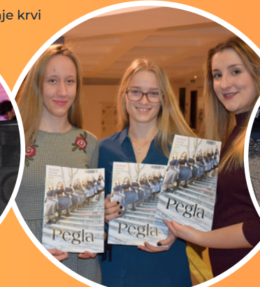
Školski list - Pegla