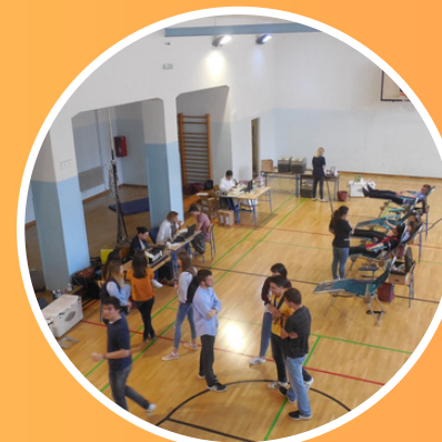
Dobrovoljno darivanje krvi