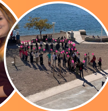
Međunarodni dan pješačenja