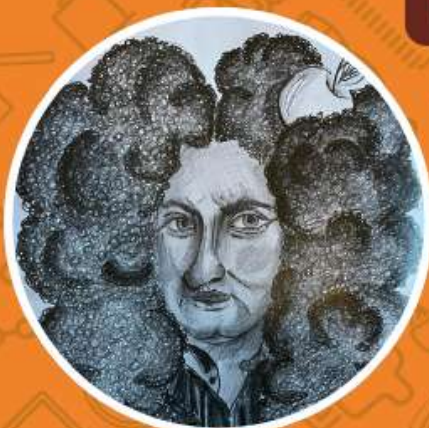
eTwinning projekt "Matematika kroz strip i karikaturu"